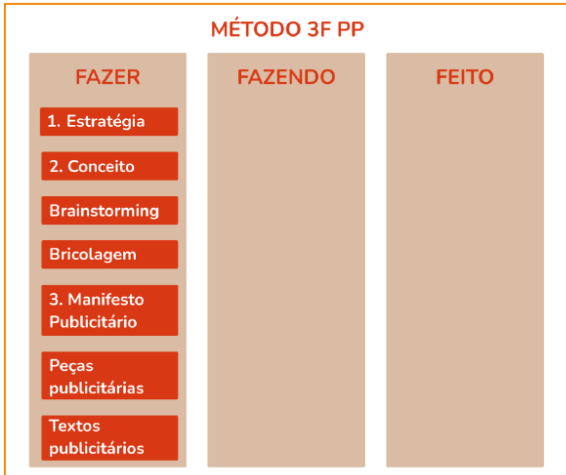
Figura 3 – Método 3F PP