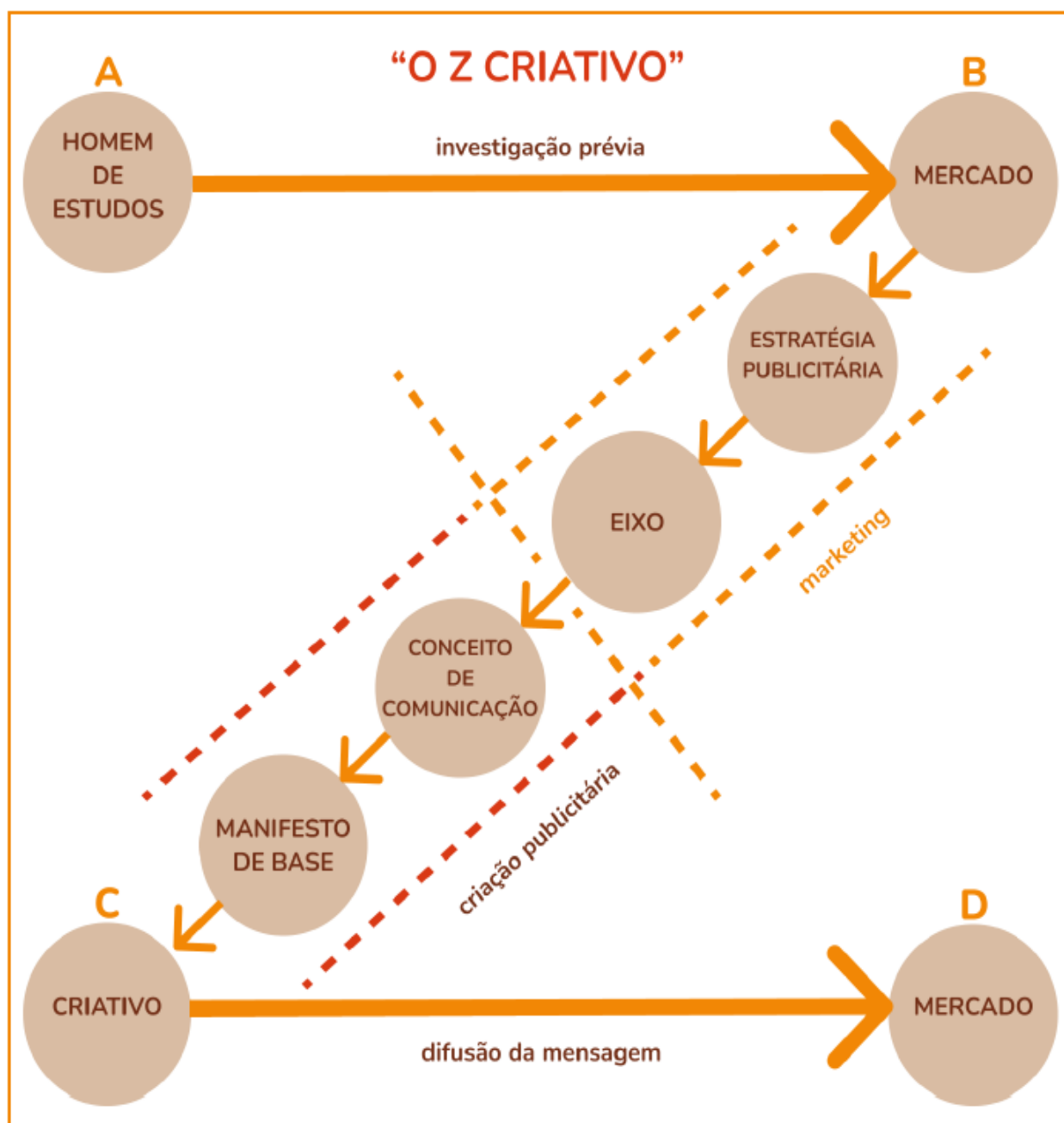
Figura 1 – Método “O Z criativo”